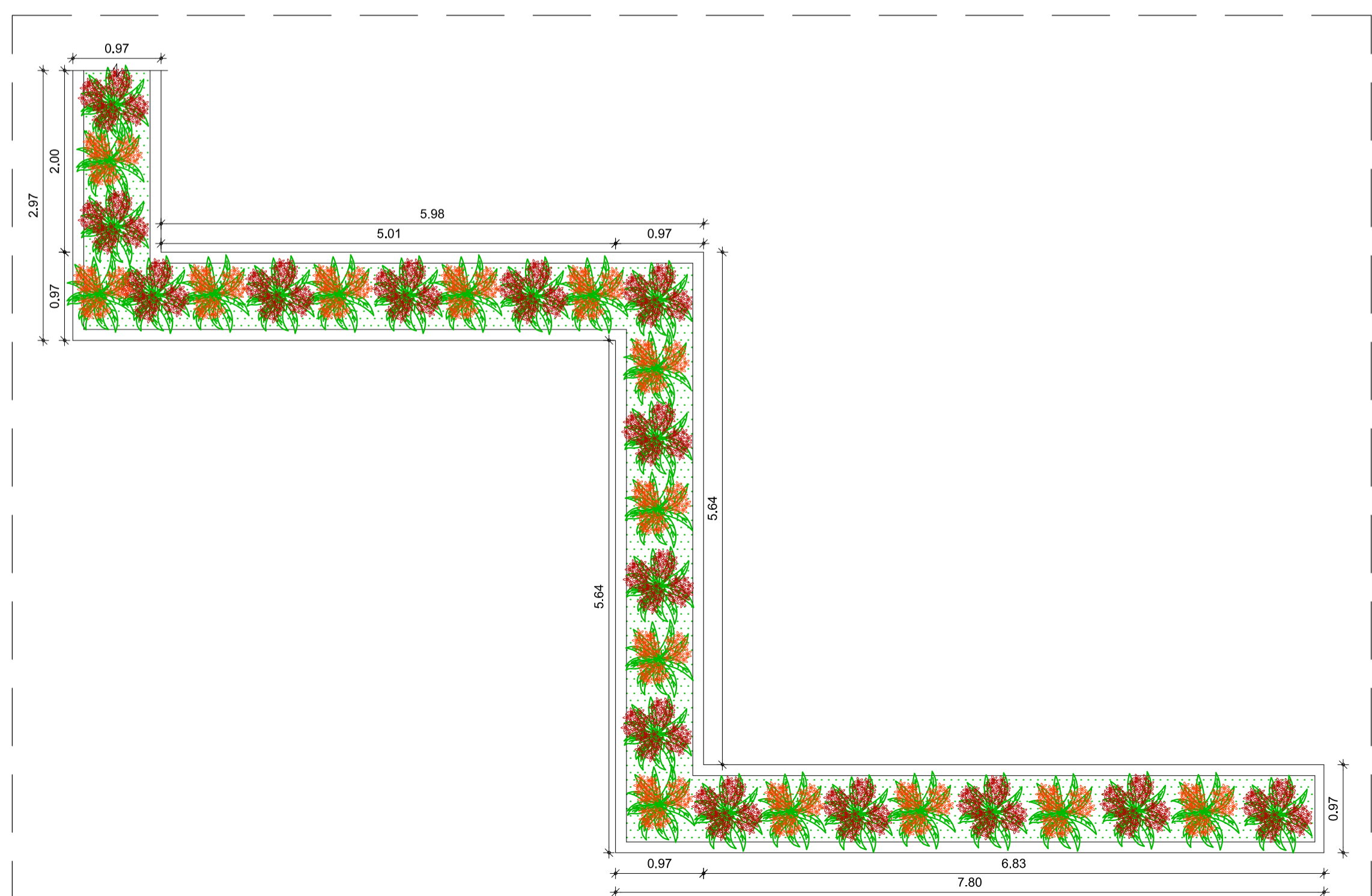
CANTEIRO 02 ESC:1/50