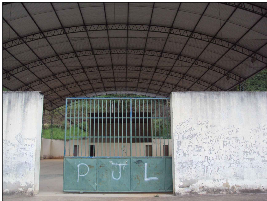
Fachada frontal - Atual