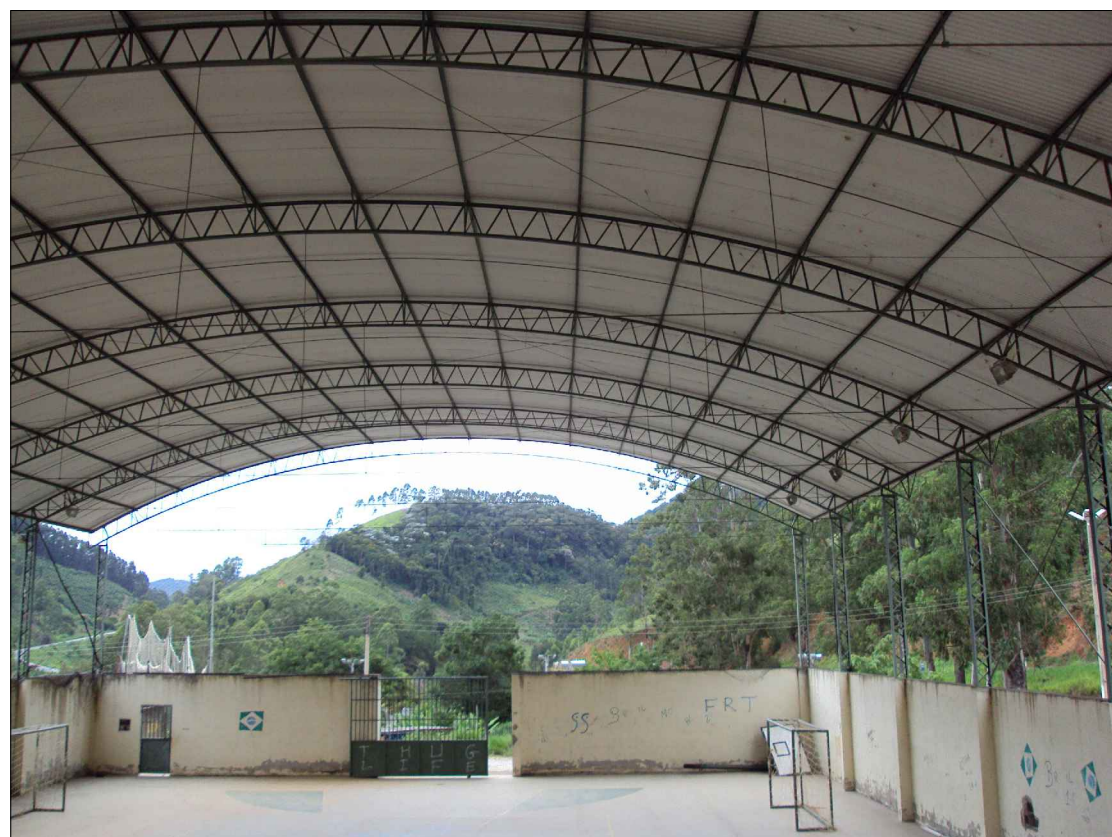
Vista do palco para fachada frontal