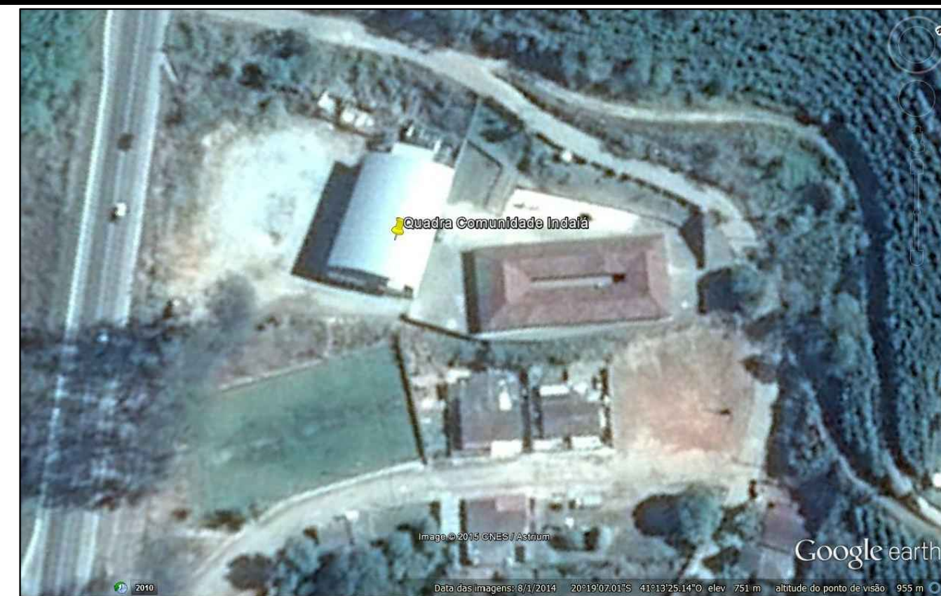
AL Localização SEM ESCALA