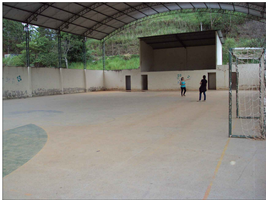
Vista da Fachada frontal para o palco