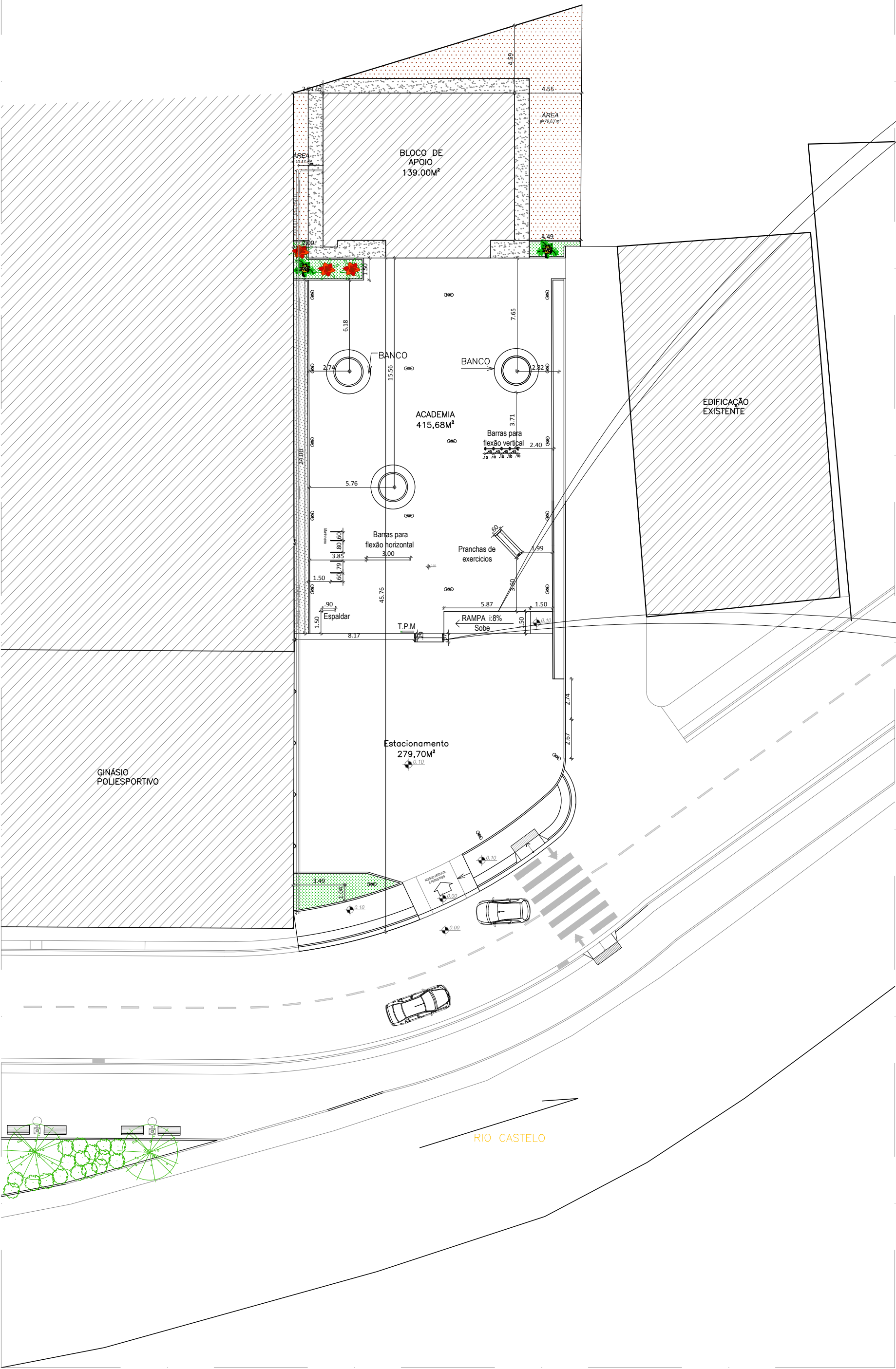
LOCAÇÃO EQUIPAMENTOS ESCALA 1:250

LATITUDE: 20°21'17.09"S LONGITUDE: 41°14'42.07"O